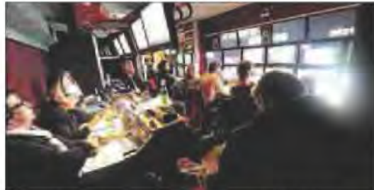
Le car-régie de l'émission, un moteur orchestrant un véritable ballet.