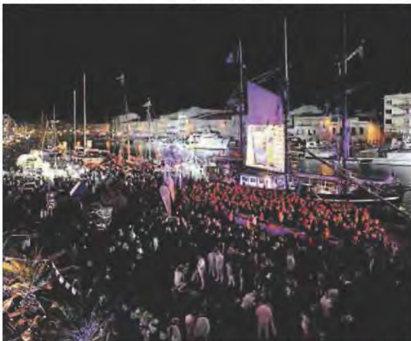
Il y avait foule sur le quai de la Marine pour assister en direct à l'émission présentée par l'"amiral" de Thalassa (depuis 1975), Georges Pernoud.