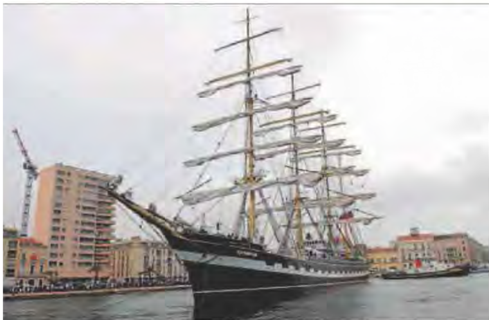
■ Le Kruzenshtern lors de sa mise en place au quai d'Alger. Seul le Sedov, russe lui aussi, le dépasse... de 3 mètres.