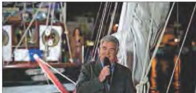
■ Georges Pernoud et le plateau de Thalassa prendront place demain sur le « Bel Espoir ».