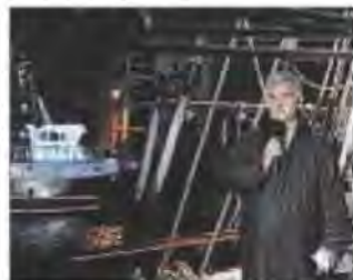
■ Georges Pernoud, présentateur emblématique de l'émission.

son bateau le Gyss , Georges Pernoud et son équipe - dont Laurent Bignolas, qui connaît bien l'étang de Thau pour y avoir souvent participé à des compétitions de voile - n'ont pas éludé des sujets plus polémiques, comme la pêche au thon ou le sort des 200 marins des trois ferries immobilisés au port pour cause d'impayés de leur compagnie marocaine (lire aussi p. 2). En tout cas, encore un bon coup de projecteur sur Sète, décidément gâtée par les médias nationaux ces temps-ci.