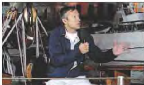
Le co-présentateur a de nombreux amis dans le secteur.